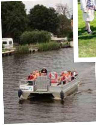
Härligt midsommarfirande med Grunden SÖSK.