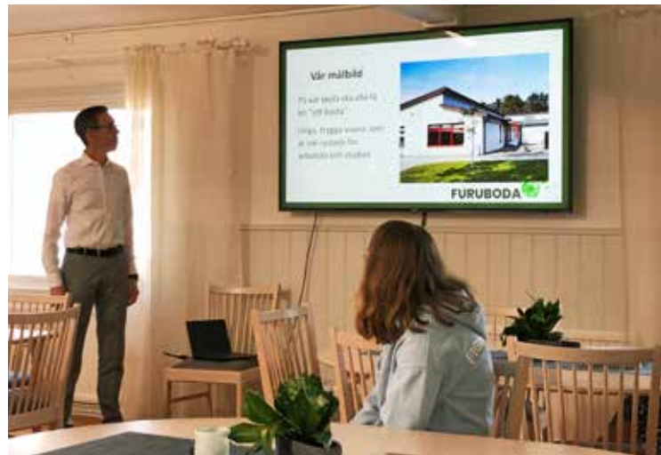
Starten på folkhögskolan hölls i aulan på Furuboda och starten för gymnasieskolan hölls i Sällskapet.

På Furuboda gymnasieskola började 12 nya elever på Naturbruk Växthus och Naturbruk Djurvård, de går på skolan tillsammans med 10 elever som går i åk 2. Vi hälsar alla deltagare och elever välkomna till möjligheternas Furuboda - välkommen hem! ●