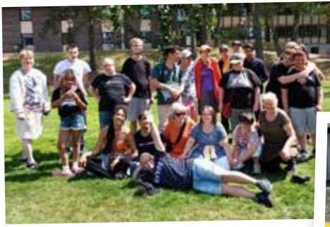
Riksförbundet EDS på tur med gula cabben.