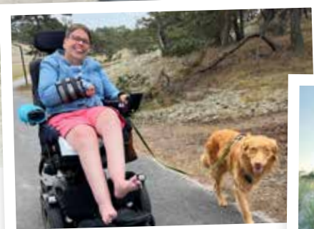
På promenad med hundarna!

Årets korta kurser på Furuboda Yngsjö blev sponsrade med glass av Kristianstads MC-grupp och Otto & Glassfabriken. Alla som deltagit under sommarens kurser tackar så jättemycket för den väldigt goda glassen och det härliga initiativet! MUMS!